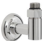
Набор комплектующих для ПК G 1/2" НР × G 1/2" НР арт. 03003-121