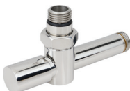
Вентиль запорный (круглый) G 1/2" НР × 1/2" НР арт. 01000-1212