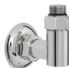
Набор комплектующих для ПК G 1/2" НР × G 3/4" НГ арт. 03002-1234