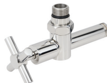
Вентиль запорный (крестовой) G 1/2" НР × 1/2" НР арт. 01002-1212