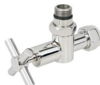
Вентиль запорный (крестовой) G 1/2" НР × 3/4" НГ арт. 01002-1234