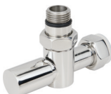
Вентиль запорный (круглый) G 1/2" НР × 3/4" НГ арт. 01000-1234