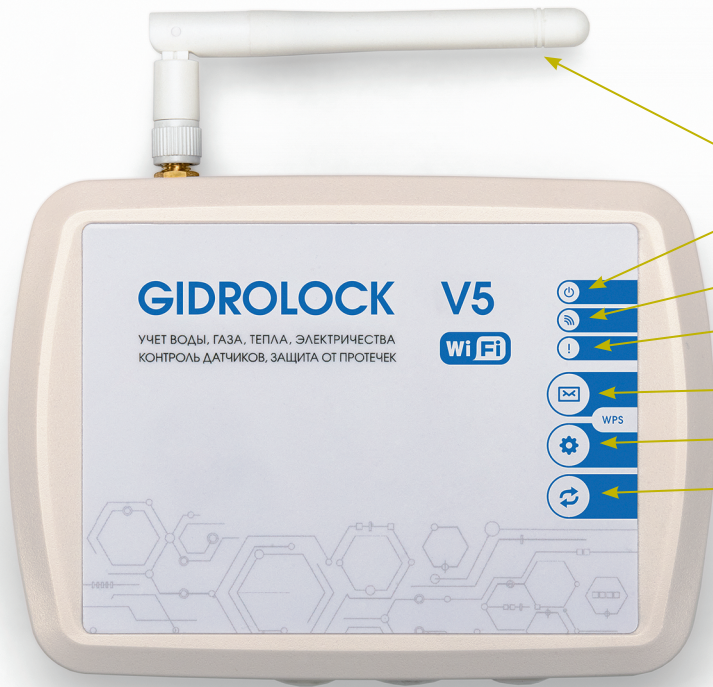
Фото 3. Блок управления GIDROLOCK Wi-Fi V5