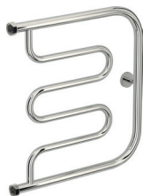
«Лира» (с полками и без)