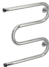
«М-образный» (с полками и без)