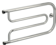
«Гусли» (с полками и без)

1.2. Конструктивно полотенцесушители выпускаются в различных моделях и типоразмерах: